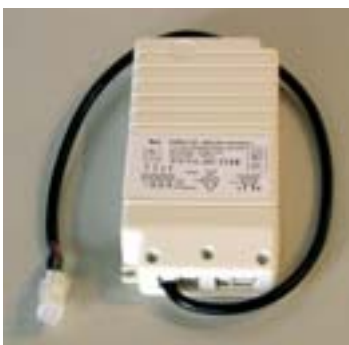
RGB-Zyklus 17 sec. 550-046-50 RGB-Zyklus 60 sec. 550-046-50/60

Switching ON/OFF (Memory function of the last colour regulation) Regulation of all 3 colours to 100% Changing colour (up to 2,097,000 colours possible) automatical colour flow