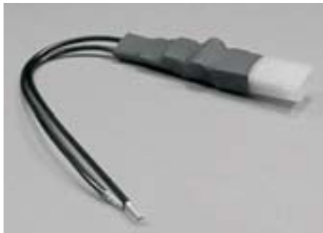
Zwischenmodul von 12 V Wechselstrom auf 12 V - Gleichstrom, max. Belastung 6 W, AE / Steckverbindung, schwarz [Intermediate module from 12 V AC to 12 V DC, max. power 6 W, connector, black]