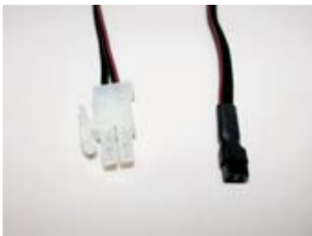
Einspeisungskabel für Leiterplatten Art.-Nr. 551-930 bis 551-945 [input cable for PCB Art.-no. 551-950 to 551-945]