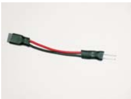
Verbinder für Leiterplatten Art.-Nr. 551-930 bis 551- 945 [connector for PCB art.-no. 551-930 to 551-945]