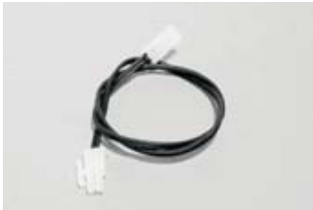
Verlängerungskabel (10 Stück), schwarz [extension flex with connector (10 pieces), black]